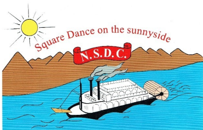
Nørresundby Square Dance Club